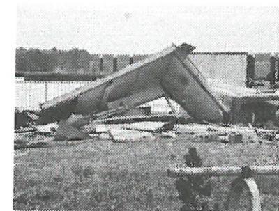
損壊したフィッシャリーナ受付所