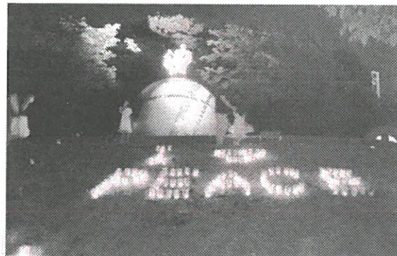
マザー・アースの前には「I ♥ PEACE」の文字がろうそくの光で照らし出されました。

落合市長は、これからの若い人たちに平和の尊さをつなげていくことの大切さを語られました。