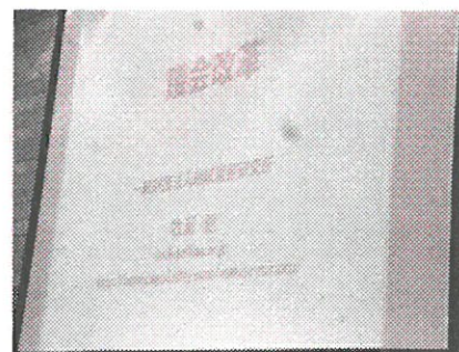
11月22日(火) 湘南地方市議会議長会議員研修会にて

※請願の締め切りは本会議2日目12月6日(火)です。提出される団体・個人の方は午後5時までに市庁舎8階の議会事務局にお持ちください。また、請願の委員会趣旨説明を希望する団体は提出時に申し入れをしてください。