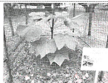
平塚市総合公園「平塚のはらっぱ」に植樹された『被爆アオギリ』の苗も元気に成長しています

以来、市民と市が協働して平和の尊さ、大切さを訴えるために「アイ・ラブ・ピース」を合言葉に、恒久平和を求めて年間を通じて「市民平和の夕べ」「平塚空襲の日キャンペーン」「市民広島派遣」「パネル展」など様々な事業を実施しています。核兵器のない世界は平塚市民共通の切なる願いです。