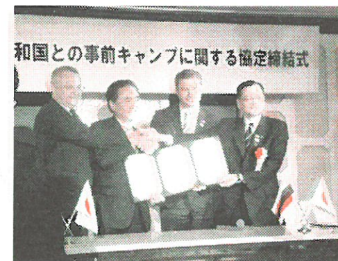
和国との事前キャンプに関する協定締結式

10月28日(金)に、2020東京オリンピック・パラリンピックの事前キャンプ地として平塚が決定しました。