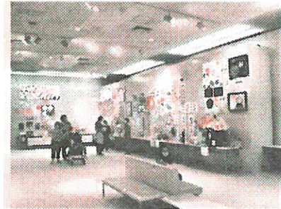
中央公民館2Fギ ャラリーで開催さ れた「社会福祉展」

介護保険法施行令改正により、介護保険認定審査会の委員の任期の機関を2年→3年に改めるための規定を整備する。