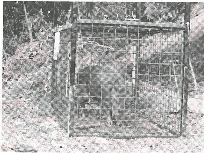
このイノシシが捕獲された写真は、農水産課より提供いただきました。

平塚市では、平成27年度から29年度までの「平塚市鳥獣被害防止計画」をつくり、県政総合センター、JA湘南、猟友会、警察と連携して対策を講じています。