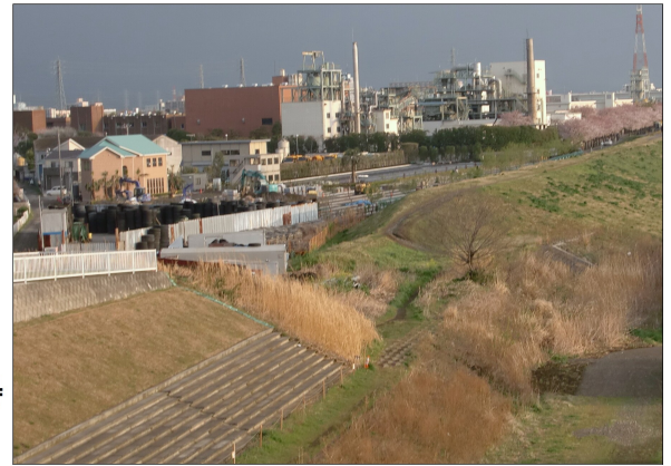
相模川(右側)の堤防の整備工事現場(写真中央)。(田村8・9丁目)

議会で要求し、右岸河口付近の堤防整備が計画より1年早く2013年度に完成。四之宮地区の堤防未整備箇所を急ぐようもとめ、2016年の早期完成を目指すとの答弁を得ました。